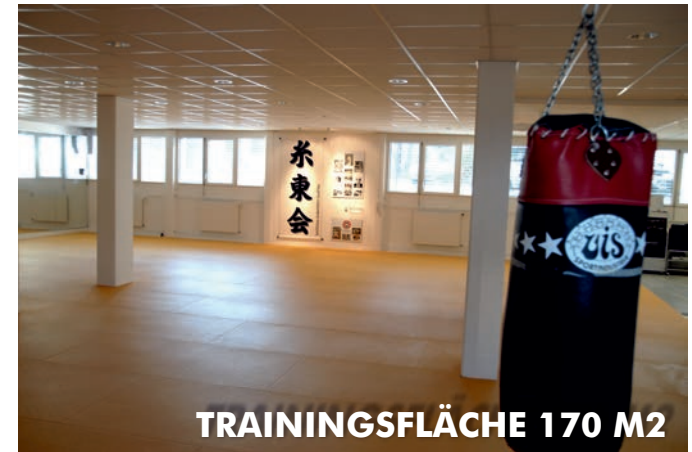
TRAININGSFLÄCHE 170 M2