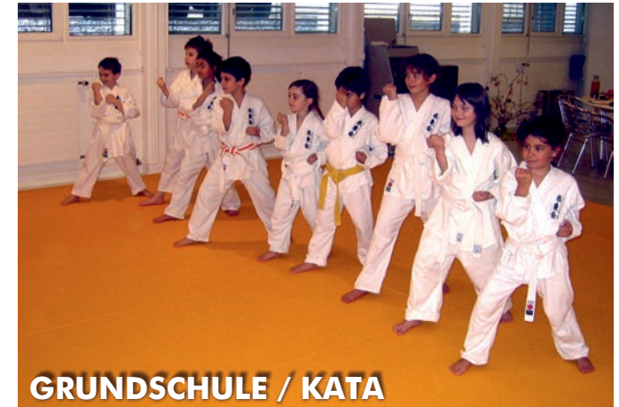
GRUNDSCHULE / KATA