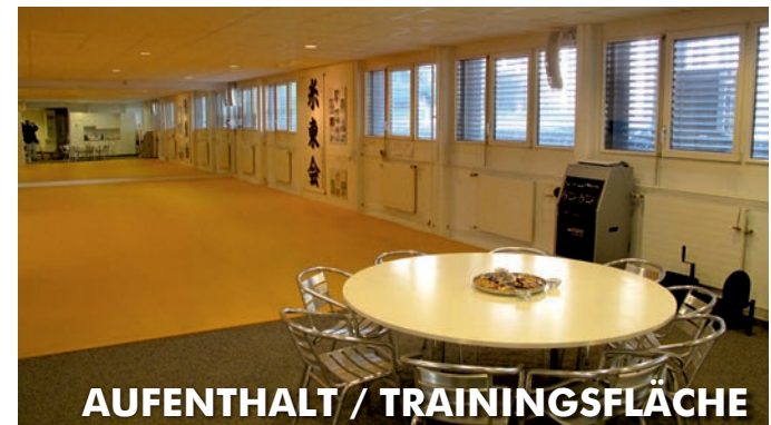
AUFENTHALT / TRAININGSFLÄCHE