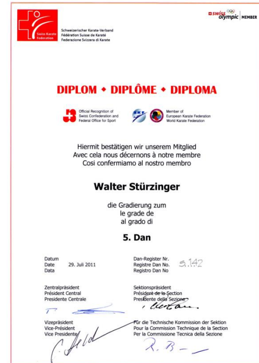
DIPLOM SWISS KARATE FEDERATION (SKF)